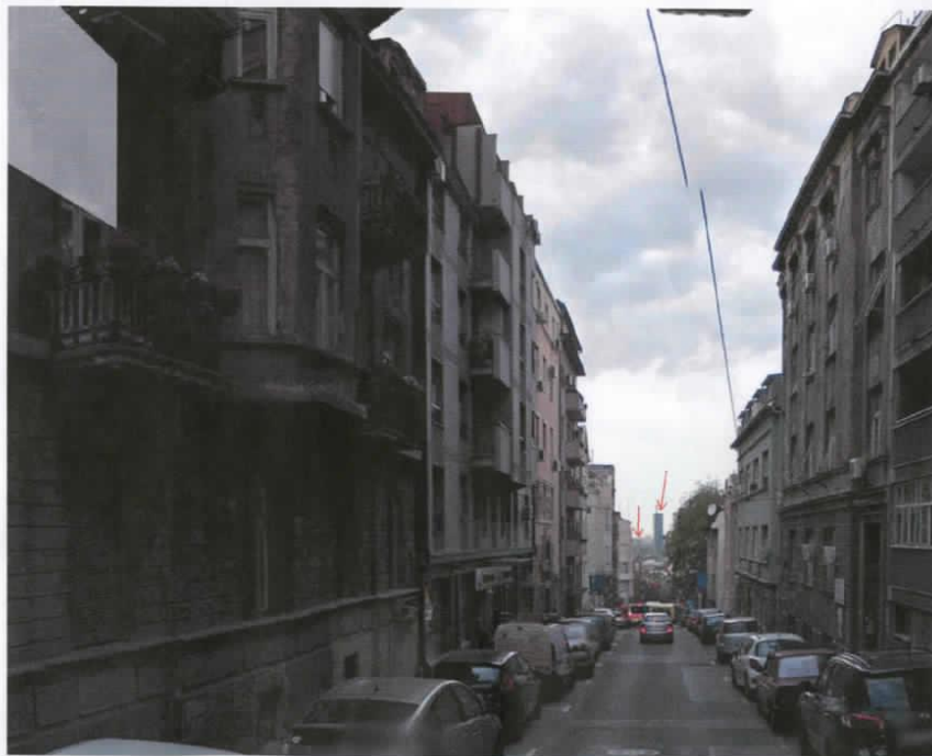
stajna tačka - ul. Resavka