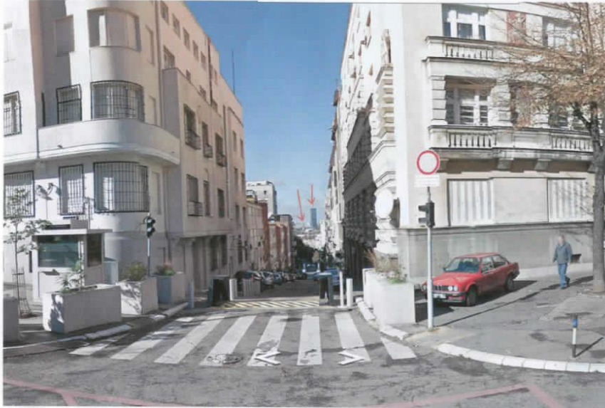
stajna tačka - ul. Kneza Miloša